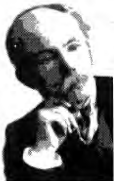
Arne Garborg 1851-1924