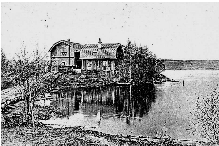
Kampudden, Fjæstads villa vid sjön Racken i Arvika.